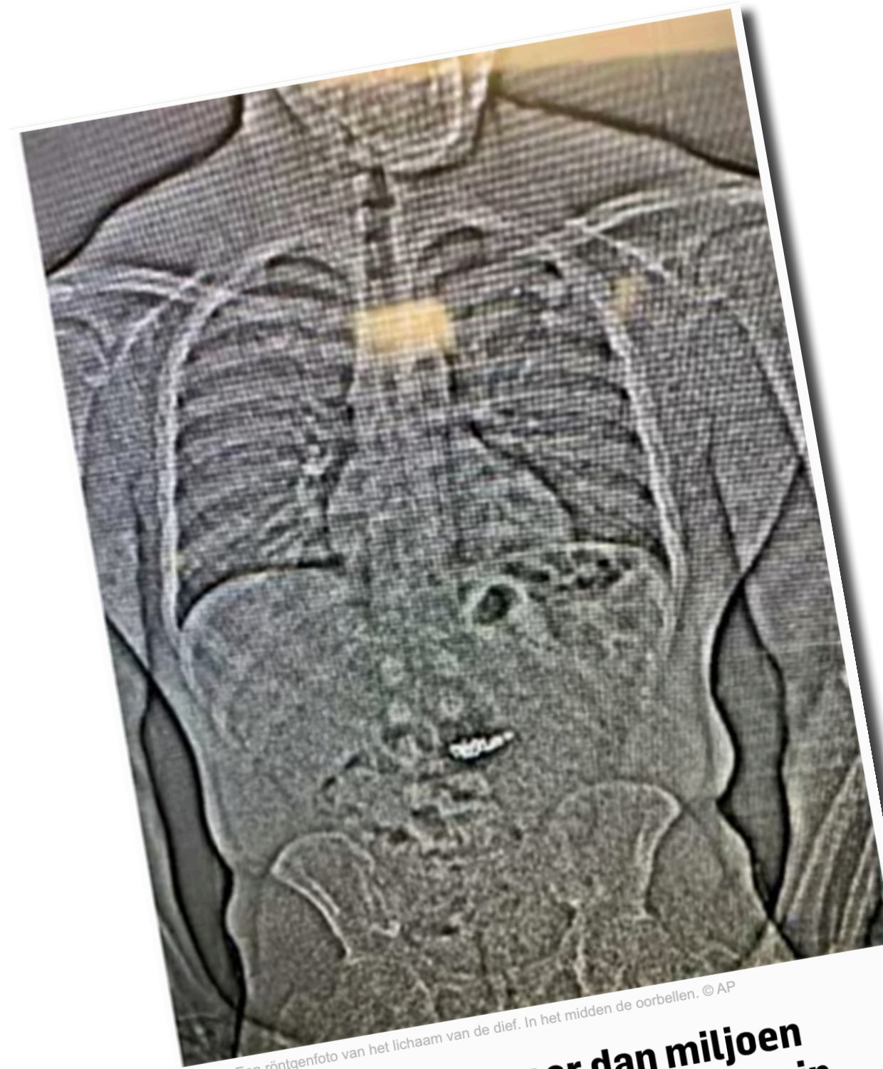
▲ Een röntgenfoto van het lichaam van de dief. In het midden de oorbellen.

Bespreek met elkaar met de kennis die je hebt opgedaan door deze opdracht welke nieuwsgebeurtenis je afgelopen week het meest nieuwswaardig vond en waarom.