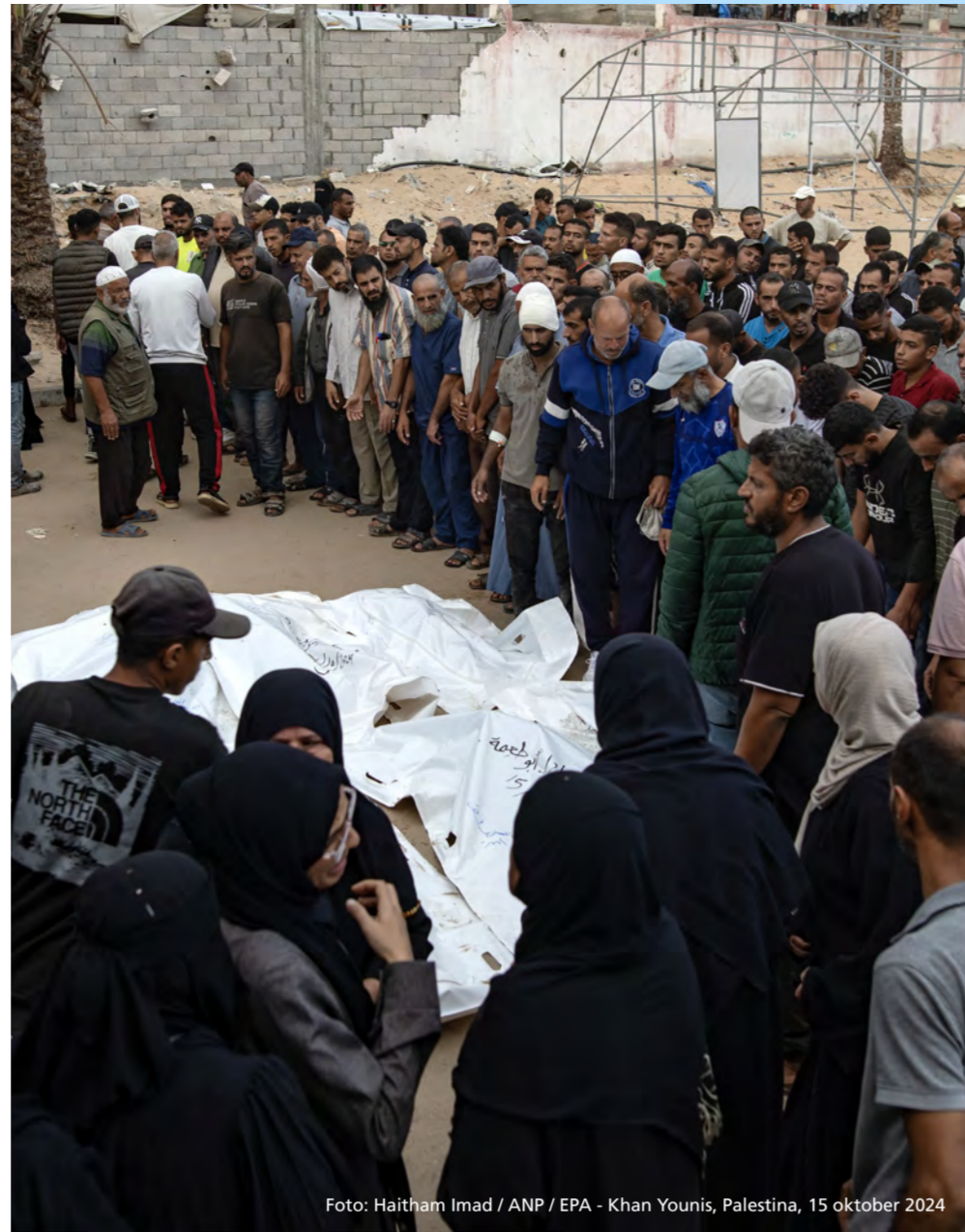
Khan Younis, Palestina, 15 oktober 2024