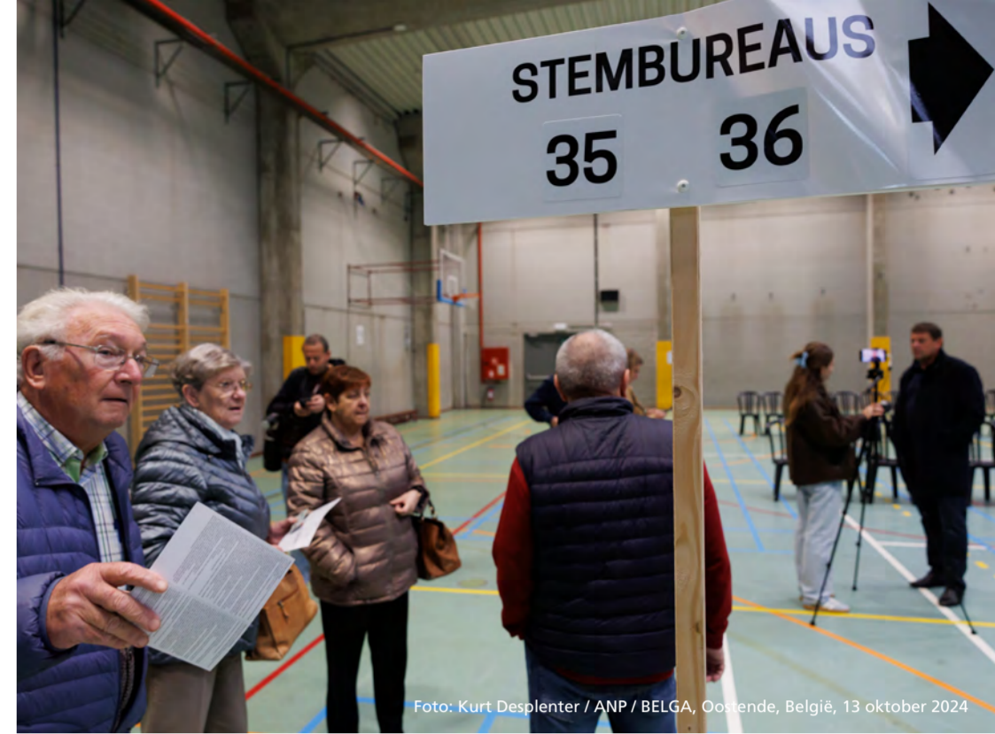
Foto: Kurt Desplenter / ANP / BELGA, Oostende, België, 13 oktober 2024