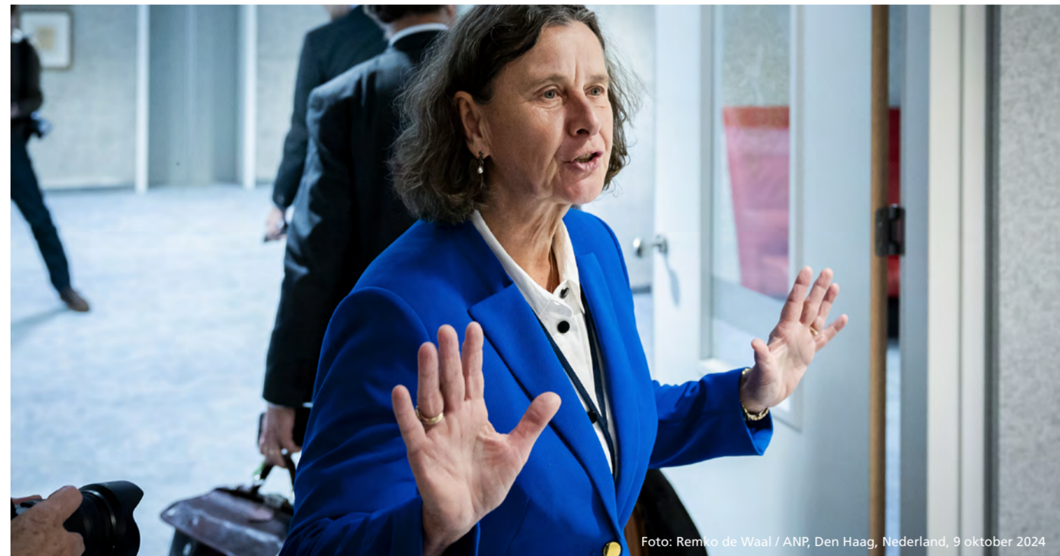
Den Haag, Nederland, 9 oktober 2024