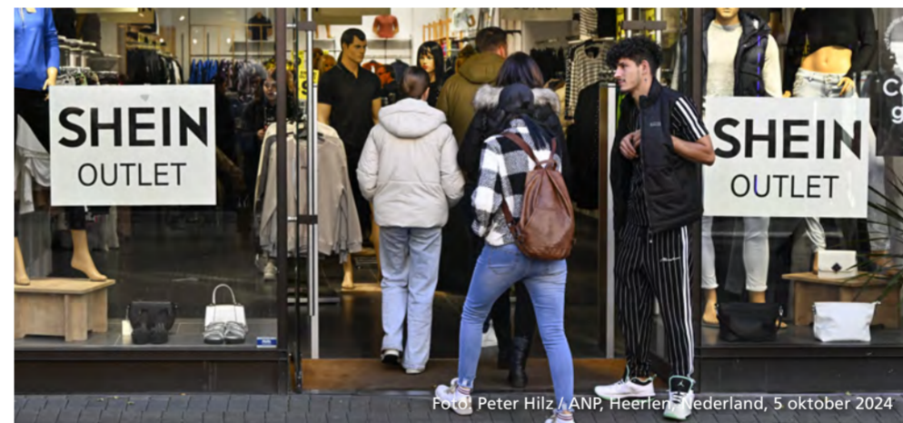
Heerlen, Nederland, 5 oktober 2024