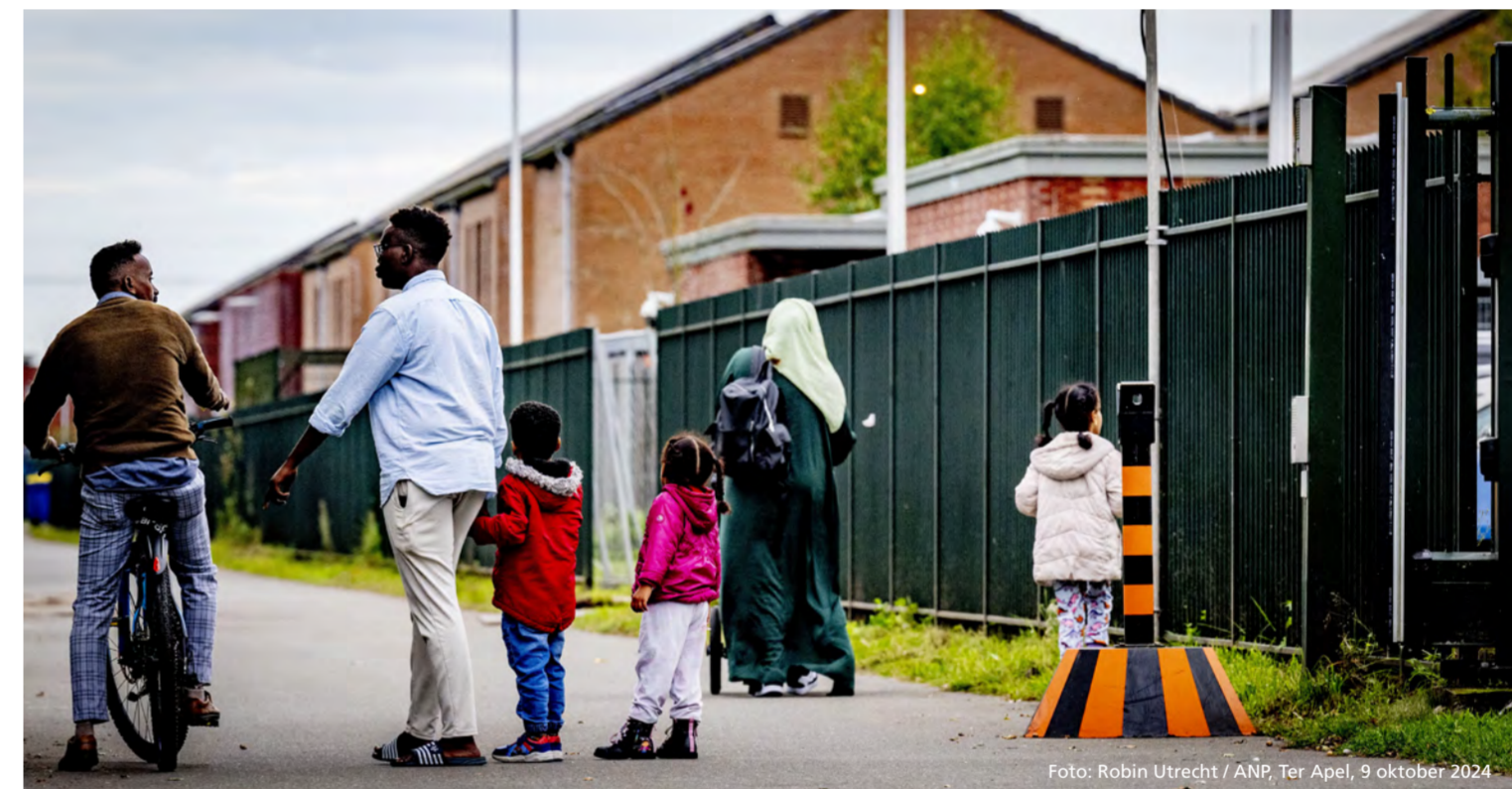
Ter Apel, 9 oktober 2024

Dit is waar de overheid een rol speelt; of