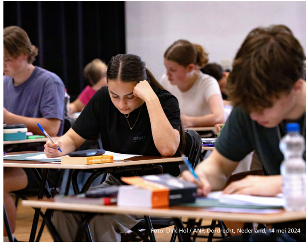
Dordrecht, Nederland, 14 mei 2024