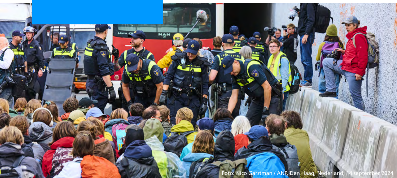
Den Haag, Nederland, 14 september 2024

Klimaatactivisten wie kent ze niet. Ze lijmen zich vast, ze blokkeren wegen en bekladden schilderijen. Super irritant natuurlijk. Hebben ze dan niks beters te doen? Ik denk van wel laat mij het jullie uitleggen.