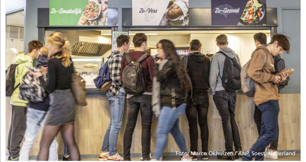
Soest, Nederland