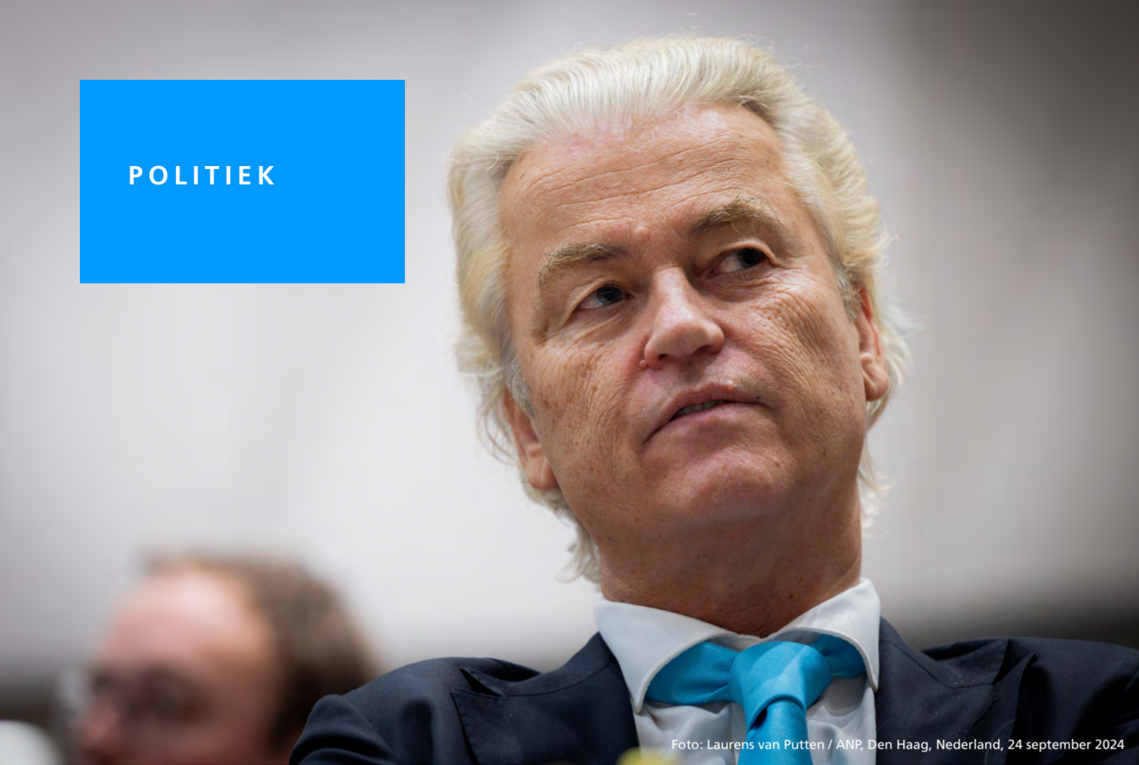
Foto: Laurens van Putten / ANP, Den Haag, Nederland, 24 september 2024

• Klaas (17): 'Meneer Wilders, wat blijft er over als alles alleen nog maar minder is?'