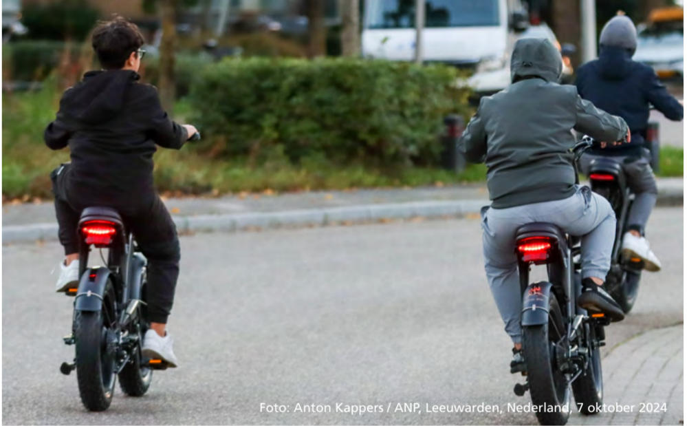
Leeuwarden, Nederland, 7 oktober 2024

Vorige week is er een wet online gekomen die misschien ergens komende tijd wordt ingevoerd: Vanaf veertien jaar en ouder mag je een fatbike en als je die dan hebt, moet je een helm dragen. Mijn vraag is echter: Welk probleem lost dit op en wat is ons probleem eigenlijk met al de fatbikes?